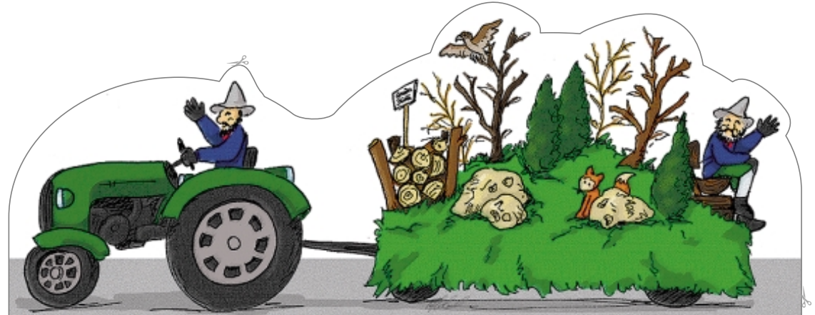
Stöckberg-Wagen Narrenverein Oberstetten e.V.