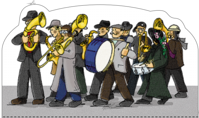
Lombakapell Narrenverein Oberstetten e.V.