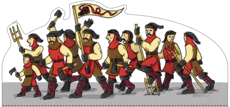
Bondschua Narrenverein Oberstetten e.V.